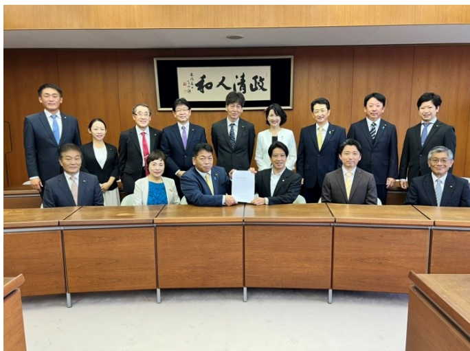
市長に予算要望書を提出 (令和4年10月17日)